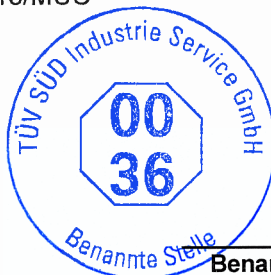
(Dr. R. Hackl)

Zertifikat-Nr.: DGR-0036-QS-W 730/2015/MUC München, 30. Dezember 2015