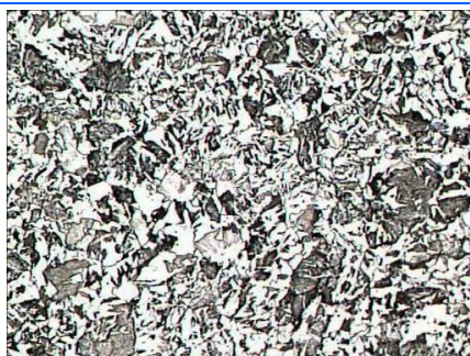
Materiale allo stato naturale Struttura: ferrite, sorbite e bainite x200